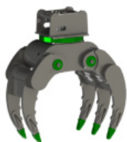
MD9.0 VEČNAMENSKI GRABEŽ „ALIGATOR“

Večnamenski Grabež »Aligator«, za hlodovino, biomaso, kamen, delo v gozdu, sortiranje odpadkov