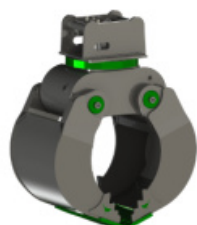
MD12.0 UNIVERZALNI „BEST GRIP GRABEŽ“