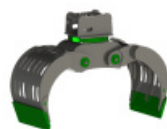
MD12.0 SORTIRNI GRABEŽ