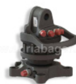
ROTATOR GR30PF 3-TONE