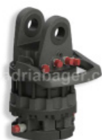
ROTATOR GR12S 12-TON