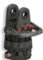
ROTATOR GR12S 12-TON