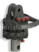
ROTATOR GR55M 5,5-TONE