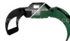
( KOMPLET ) GOZDARSKA KLEŠČA FE-510 TM1300 + ROTATOR GR30 585 - FL 105 2,0-3,0 TON

Simbol IMEX je oznaka strukturnega jekla, za konstrukcijsko uporabo. Zaradi svoje sestave in toplotne obdelave, ima odlične mehanske lastnosti. IMEX jekla se uporabljajo v težki industriji, kot so raztezne dvizne vrvi mobilnih žerjavov in v delovnih strojih, kjer mora biti material vzdržljiv. Klešče z oznako IMEX, so vzdržljiva in robustna.