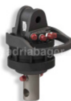
ROTATOR GR46 4,5-TONE