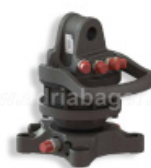
ROTATOR GR30PF 3-TONE