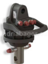
ROTATOR GR30 3-TONE