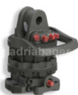
ROTATOR GR55MF 5,5-TON